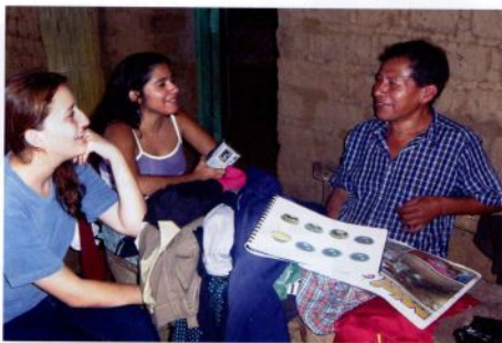
El refuerzo visual como dispositivo de la memoria.

Con su pesada cámara captó a Nahuizalco y su gente en los días de mercado, repleto de vendedores locales y foráneos que comercializaban una variedad de productos que