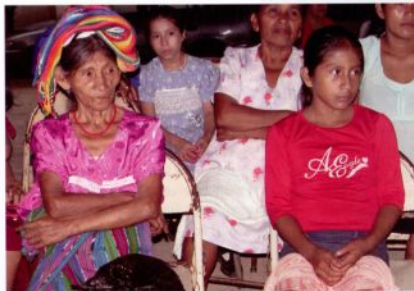
En los trabajos con grupos locales se abre el diálogo intergeneracional.

Este ejercicio permitió generar una yuxtaposición entre las imágenes visuales plasmadas en el papel y las imágenes recreadas a partir de los relatos de los pobladores, articuladas a partir de su propia memoria. De esa manera