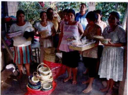
Grupo de mujeres artesanas de Cantón Pushtán organizadas en ASDEIS.

Es así, que el relato mitológico, el testimonio, la fotografía y el documento escrito de Hartman sirvieron como dispositivos de la memoria en nuestro trabajo de campo. Una etnografía comparativa que ha tenido como herramienta los ejercicios de la memoria en comunidades de la región de Los Izalcos, memoria, provocadora de olvidos, recuerdos, negaciones y apropiaciones. Un proceso que tendrá continuidad, en manos de las propias comunidades, cuando la Exposición “Memoria de los Izalcos” continúe recorriendo los caminos de la zona occidental de El Salvador retornándole a las comunidades sus propias elaboraciones culturales.