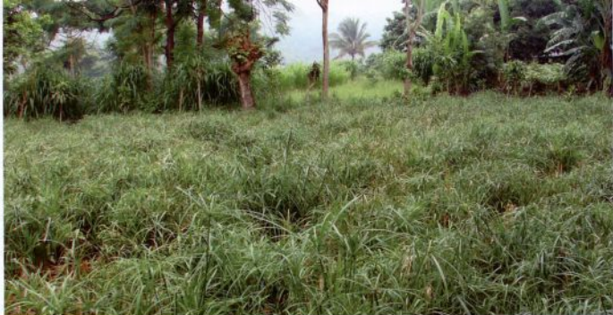
Sembrado de tule, Cantón Pushtan

llevaron a algunas mujeres a discutir como mejorar su propia artesanía. Las entrevistadas ubicaron a la planta del tule como elemento cultural identitario en el cual se ven representadas, aunque reconocen que actualmente esta planta se esta dejando de producir debido a no poseer tierras para su siembra, al alto costo del arrendamiento de una parcela y al hecho de que tienen que esperar todo un año para que se dé la cosecha. Eso determina que se abandone ese cultivo y en lugar del tule se planten maíz, frijoles y hortalizas.